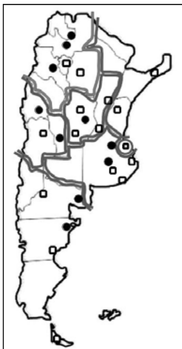
Mapa N° 2: Logística de campo (ENES)

Nota: Las líneas grises indican los límites de las 7 regiones. Los cuadrados y círculos indican las localidades de emplazamiento de las unidades académicas de CODESOC involucradas en el trabajo de campo. Los cuadrados indican, además, las sedes de los talleres de capacitación de los encuestadores.